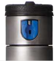
I-20 s modrou štandardnou tryskou

Čierne s krátkym dostrekom (obj. č. 466100)