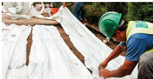
Nainštalovaná rohož Eco-Mat